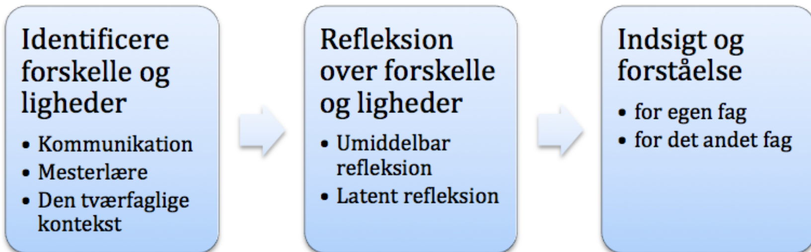
Illustration over hvilke faser medicin- og sygeplejerskestuderende gennemgår når de modtager tværfaglig klinisk undervisning.