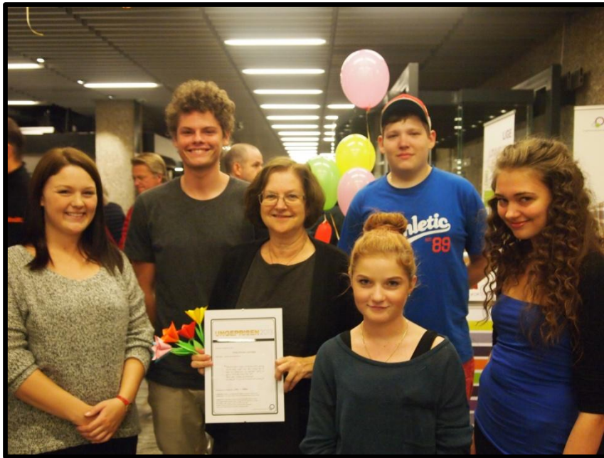
Uddeling af Ungeprisen 2013 ved Kulturnatten 11. oktober 2013

Læs mere om Ungdomsmedicinsk Videnscenter på www.ungdomsmedicin.dk eller scan koden: