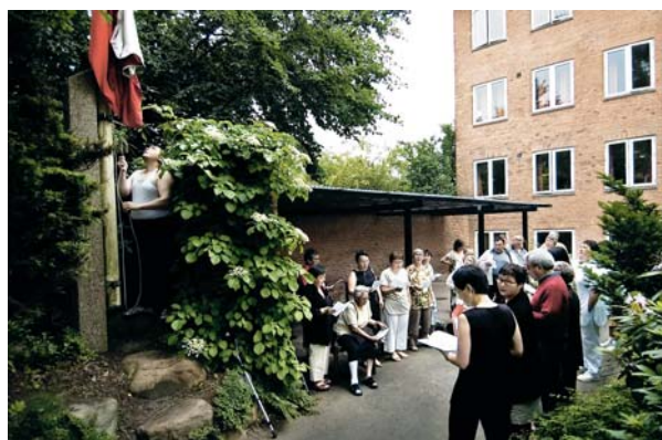
Den 21. juni er nationaldag i Grønland. På Det Grønlandske Patienthjem fejres dagen med en stor grillfrokost, inden de, der kan og har lyst, tager med bus til Det Grønlandske Hus i København, hvor der er middag og fest. Dagen begynder med flaghejsning og grønlandske sange.

◊ Hermed slutter serien om de grønlandske patienter.